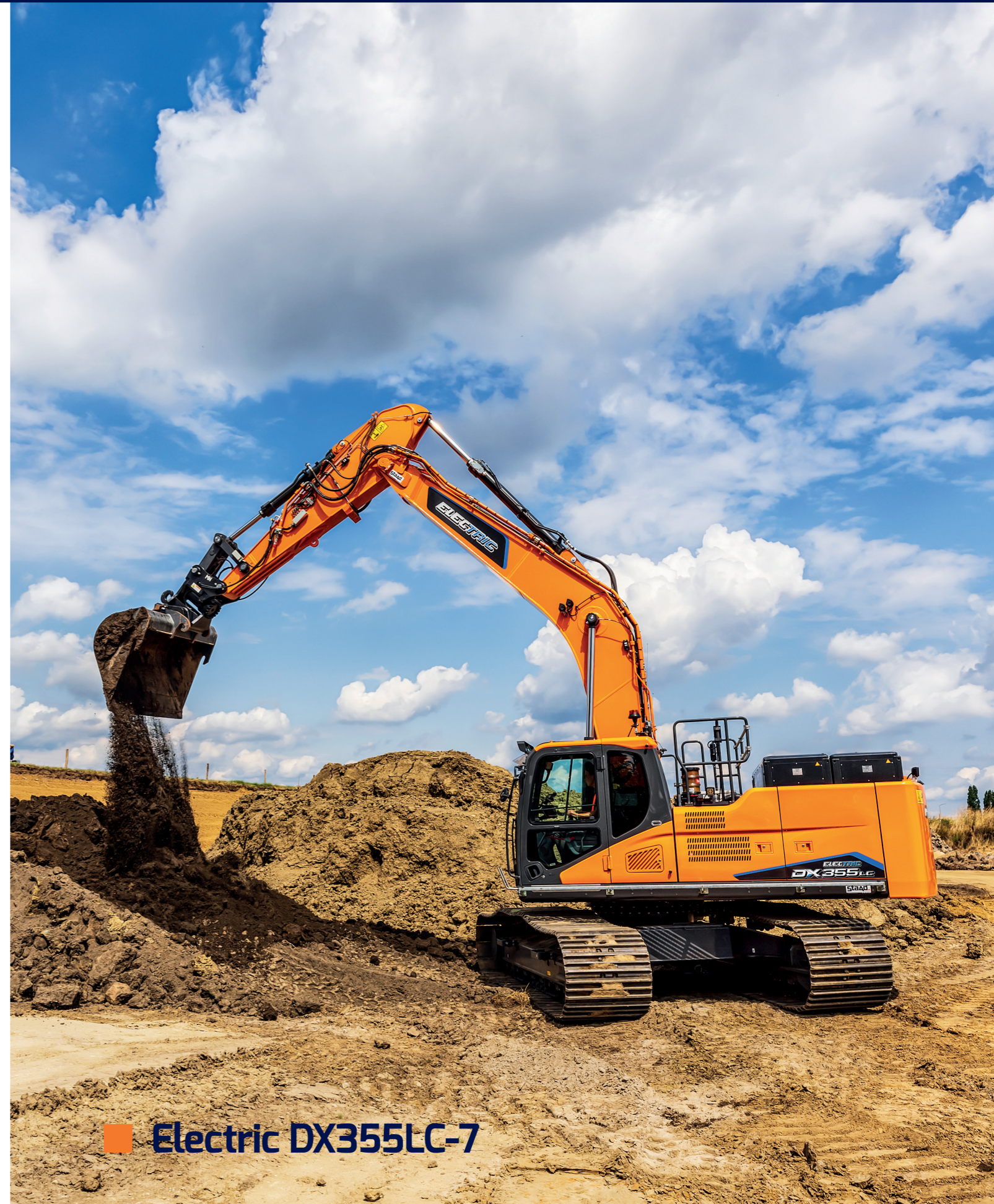
■ Electric DX355LC-7