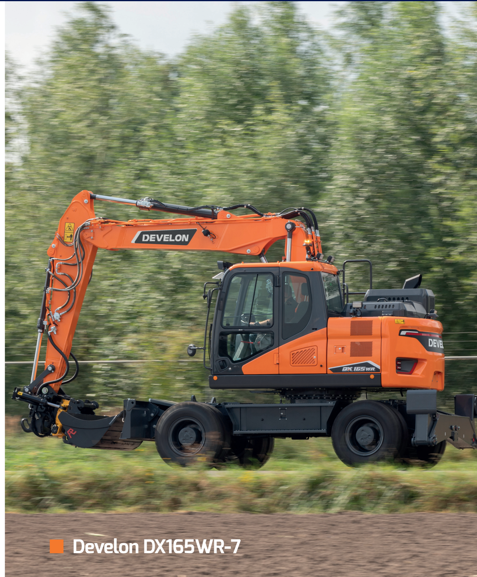
■ Develon DX165WR-7

Omdat Staad constant in beweging is, breiden en vergroten we ons verhuurassortiment continu uit. Hierdoor werken we altijd met het beste materieel en sluit het assortiment perfect aan op de behoefte van jou als klant.